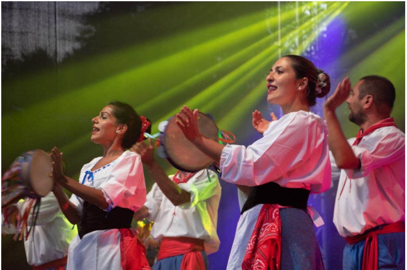
Argentyńskie tańce ludowe