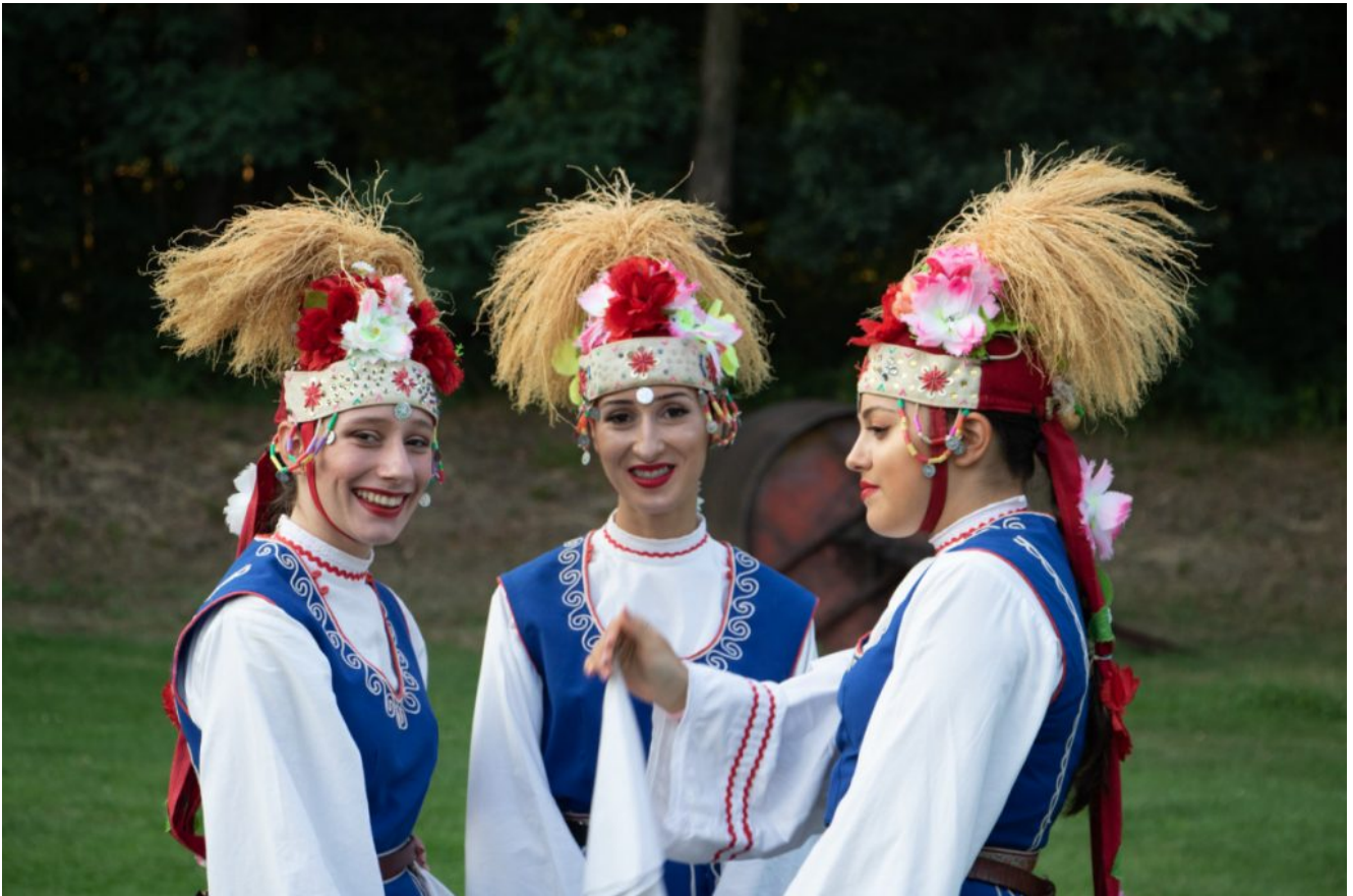
Zespół ludowy z Czech