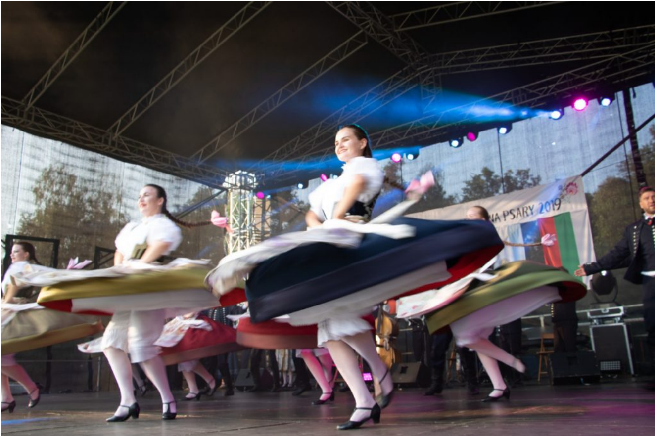
Zespół Pieśni i Tańca Ziemi Cieszyńskiej im. Janiny Marcinkowej