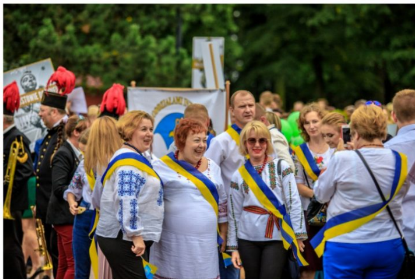
Dożynki miejskie w Bieruniu, 2019 r. Delegacje z miast partnerskich

Ми дуже стурбовані черговими новинами з України та діями Росії, спрямованими проти суверенітету нашого східного сусіда. Ми пам'ятаємо про наших друзів із міста-партнера Острога, які завжди приймають нас із неймовірною теплотою та яких ми також завжди дуже раді бачити у Беруні.