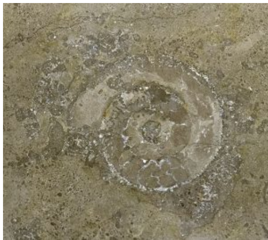
Amonit w posadzce PKZ