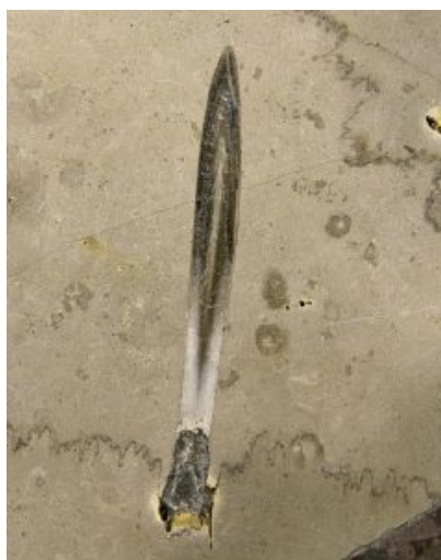
Ślady po belemnicy