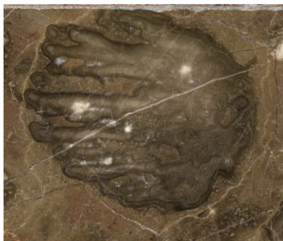
Skamieniały koralowiec