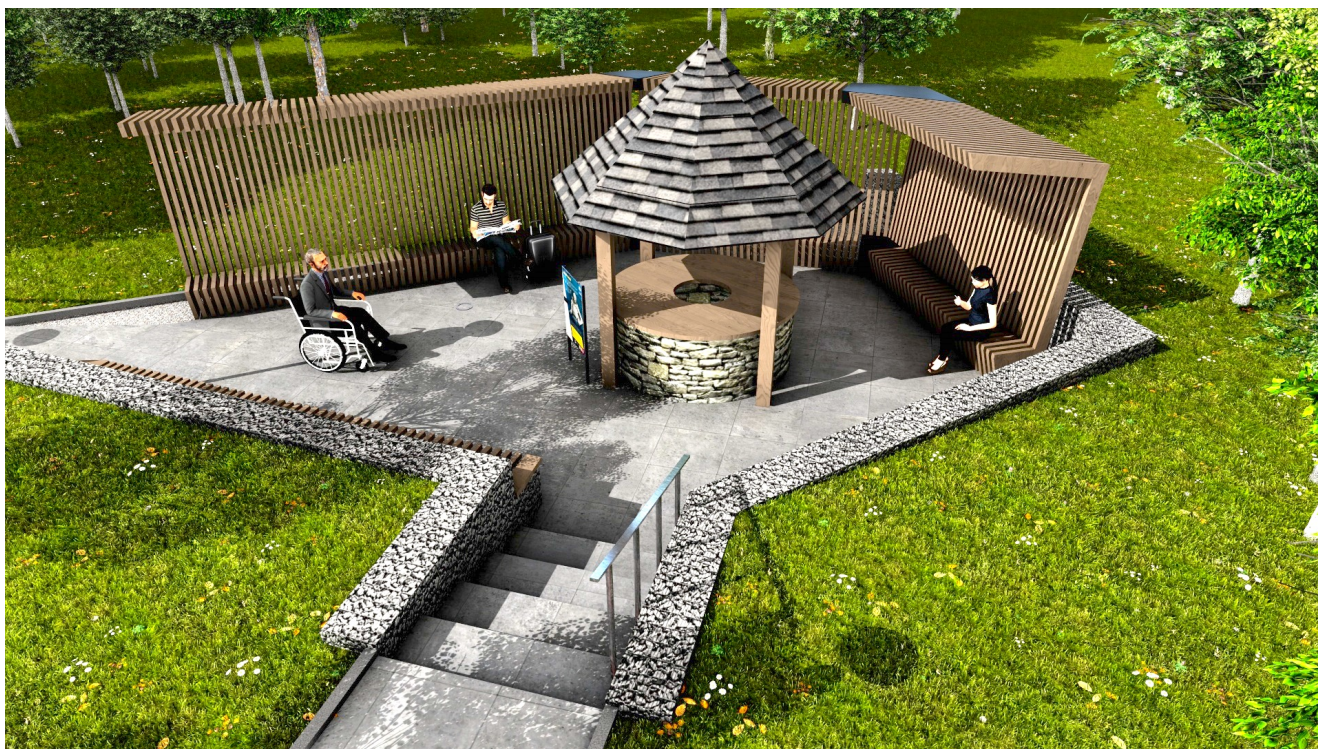
Wizualizacja zrewitalizowanego „Kadłuba”

Jednocześnie trwa budowa odcinka ścieżki rowerowej wzdłuż ulicy Chemików, przy samym obiekcie dworca autobusowego oraz prace przyłączeniowe pod budowę toalety kontenerowej na dworcu.