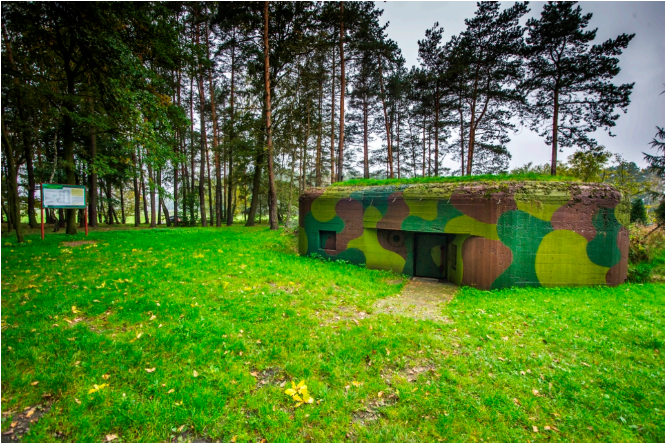
Stan obecny schronu „Sowiniec”

Sowiniec rozpoczęto dopiero w 1939 roku, przez co przed wybuchem wojny nie został ukończony. Trzeba podkreślić, że choć najbardziej znany, „Sowiniec” nie jest jedynym obiektem tzw. Pododcinka „Wiry” . Ale o tym za chwilę.