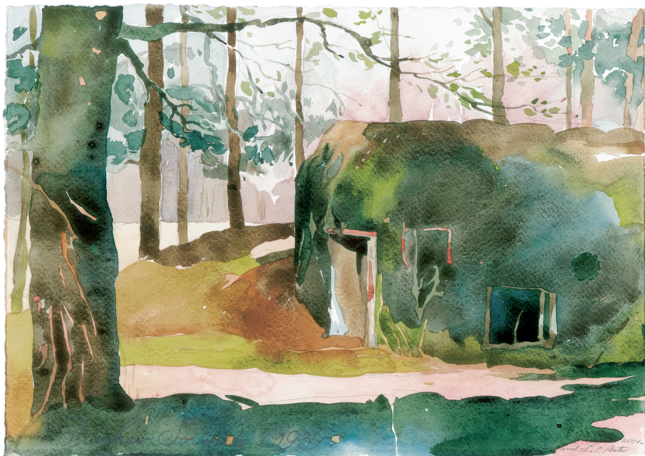
Akwarela autorstwa Sonii i Ireneusza Botorów

We wrześniu 1939 roku schron nie był jeszcze ukończony. Jego budowę rozpoczęto latem. W chwili wybuchu wojny posiadał już strop i ściany, jednak beton nie związał jeszcze wystarczająco, żeby móc wykorzystać go do walki. Przekazy mieszkańców wskazują, że aby niedokończony schron nie rzucał się w oczy przeciwnika, rozebrano częściowo szalunki i zamieniono go w stóg słomy.