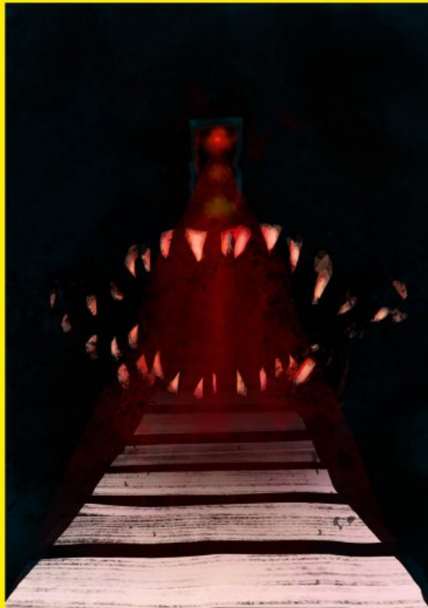
Autorem grafiki jest Wiktor Selega, uczeń Zespołu Szkół Plastycznych w Katowicach

Tylko w ostatnich pięciu latach na śląskich drogach miało miejsce 4980 wypadków z udziałem pieszych, w wyniku których 4700 osób doznało obrażeń ciała, a zginęło 433 pieszych.