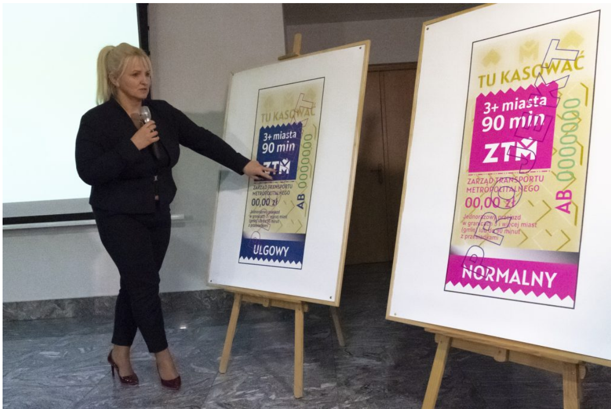
Prezentacja dotycząca nowej taryfy ZTMPobierz Nowa taryfa ZTMPobierz