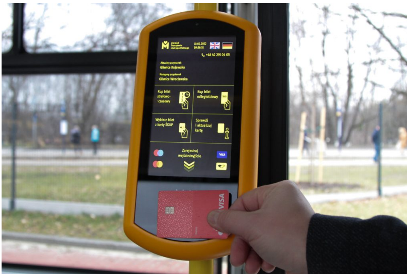
Nowa, wspólna szata graficzna urządzeń obsługujących płatności zbliżeniowe