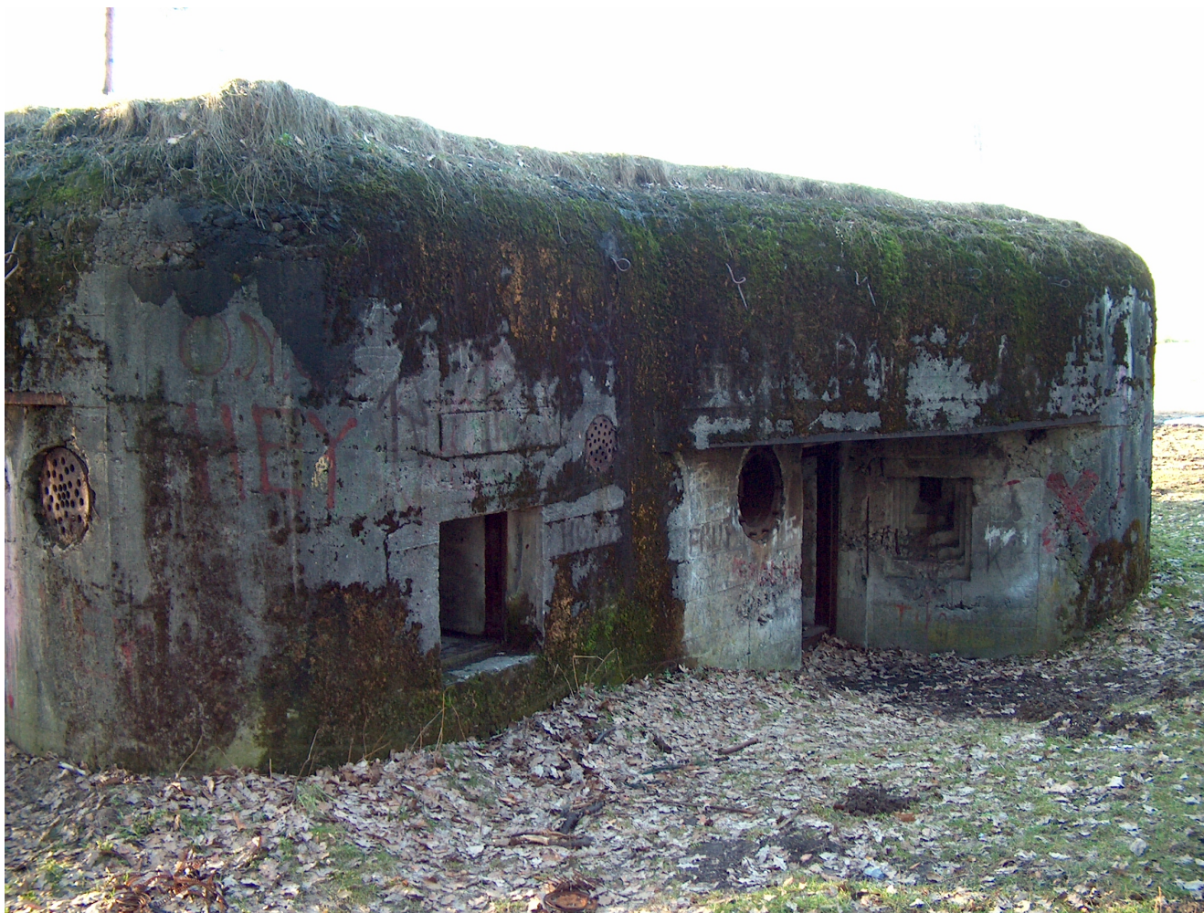
„Sowiniec” przed renowacją

„Sowiniec” to jednokondygnacyjny schron bojowy broni maszynowej. We wnętrzu znajduje się sześć izb, z czego dwie to izby bojowe. Obiekt wzniesiono w klasie odporności „C”, w konstrukcji żelbetowej monolitycznej zbrojonej prętami stalowymi. Żelbetowy strop wzmocniono stalowymi belkami z zabezpieczeniem odstępów pasami z blachy stalowej. Schron wzniesiono na nieregularnym rzucie, zbliżonym kształtem do pięciokąta, z zaokrąglonymi narożnikami ścian i stropu. Strop wraz ze ścianą od strony zach. jest obsypany ziemią. Ściana od strony pn., wsch. i pd. jest odsłonięta. Ściany zewnętrzne obecnie pokryte są farbomaskowaniem. W stropie znajdują się haki do mocowania siatki maskującej. W ścianie pn. zlokalizowana jest strzelnica ckm, wyposażona w tarczę pancerną i uskokowe zabezpieczenie przeciw-rykoszetowe. Po lewej stronie znajduje się odtworzona wyrzutnia ładunków oświetlających oraz zrzutnia granatów. W ścianie wsch.