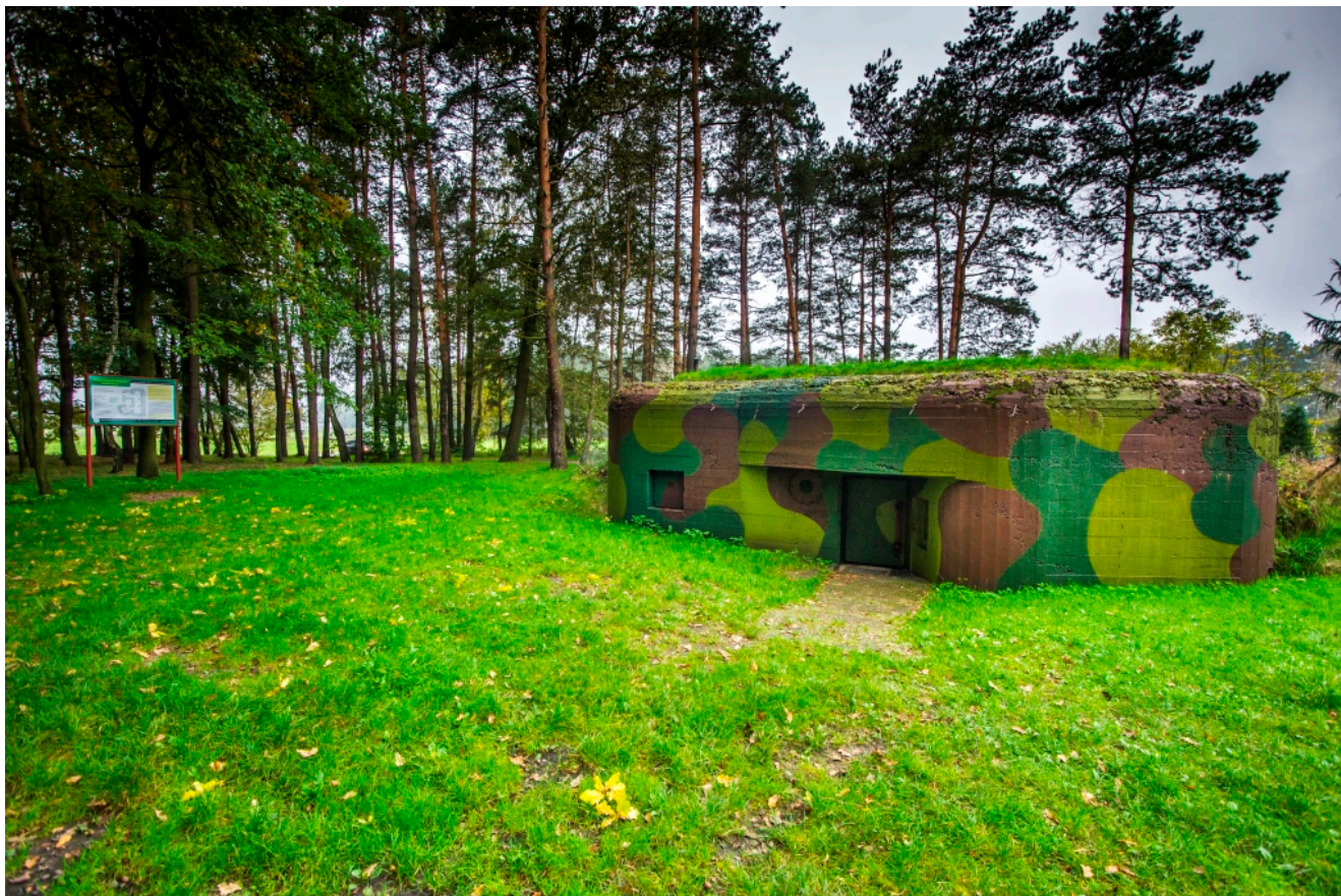
Stan obecny schronu „Sowiniec”

Sowiniec rozpoczęto dopiero w 1939 roku, przez co przed wybuchem wojny nie został ukończony. Trzeba podkreślić, że choć najbardziej znany, „Sowiniec” nie jest jedynym obiektem tzw. Pododcinka „Wiry” . Ale o tym za chwilę.